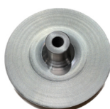
SSR RVS/inox rol