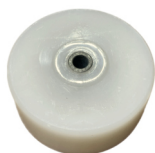
FPR polyethyleen rol